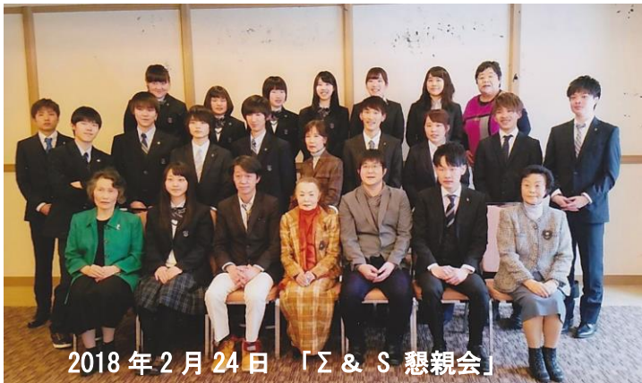
2018年2月24日「Σ & S 懇親会」

シグマソサエティ／“S”クラブの卒業生を 中心に懇親会を持ちました。社会に出てい く生徒、進学する生徒がそれぞれの進路に ついて立派に目的を持ちつつ巣立っていく 姿を眩しい思いで見ることができ、たくさ んパワーをいただきました。