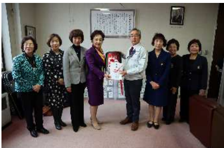
むかわ町へ支援金・ソロプチミスト号贈呈（11月22日）