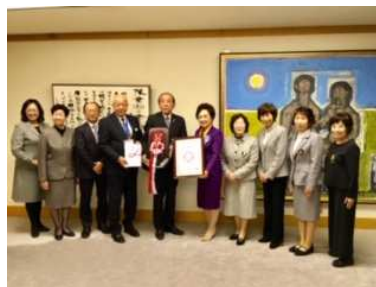
苫小牧市へ支援金・ソロプチミスト号贈呈（11月21日）