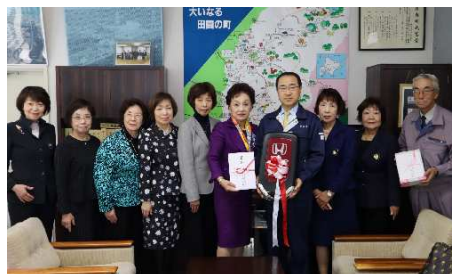
厚真町へ支援金・ソロプチミスト号贈呈（11月22日）