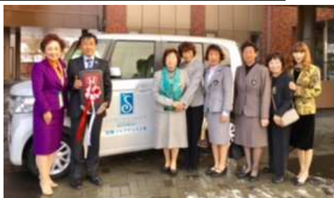
安平町へ支援金・ソロプチミスト号贈呈（11月21日）