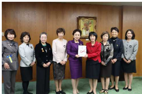
北海道へ支援金贈呈（11月29日）